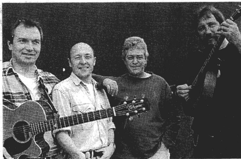
Le groupe Nordet suivra avec ses chants de marins, racontant l'aventure et la piraterie.

carrière. Le Reiser de la chanson rend hommage à « sa » Bretagne